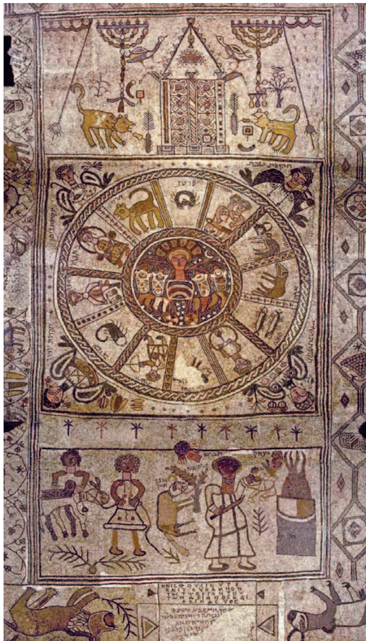
Мозаичный пол синагоги в Бет-Альфа, VI век