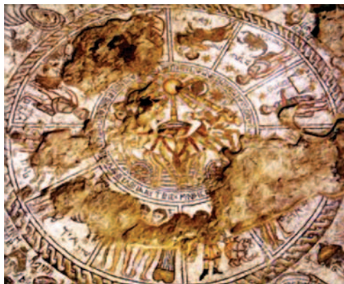
Мозаичный пол с изображением зодиака, синагога в Нааране, V-VI вв.

Drawing of the Na'aran Synagogue mosaic (courtesy of the E.L. Sukenik Archive, Institute of Archaeology, Hebrew University of Jerusalem).