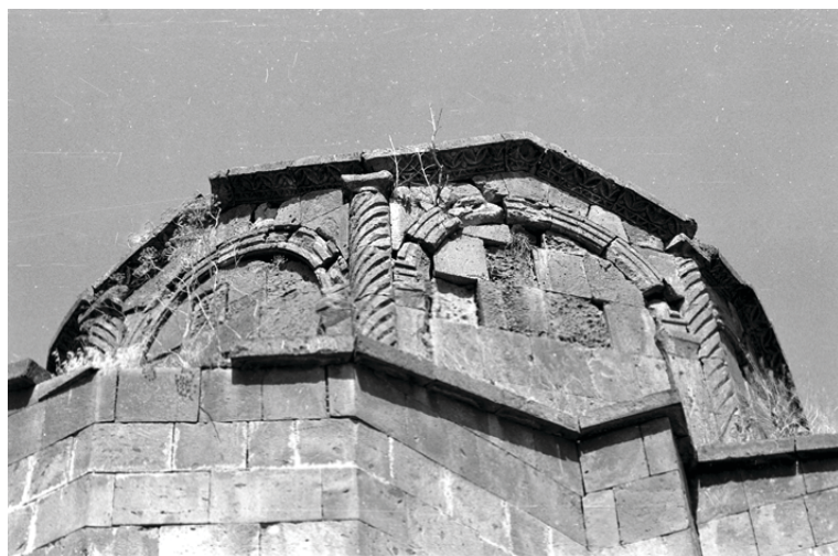
4. Барабан церкви VII в. в Зарндже