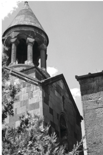
7. Церковь в Карби (1338 г.)