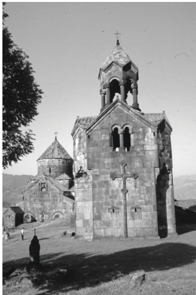
6. Колокольня монастыря Ахпат (1245 г.)