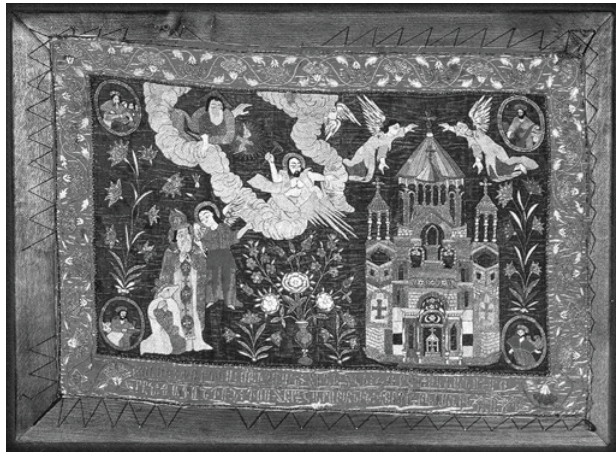
14. Завеса, бархат, шелковое лицевое шитье (Вагаршапат, 1741 г.; Золотая кладовая Эчмиадзина)