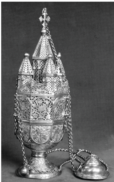
12. Серебряное кадило (Вагаршапат, XVIII в.; музей-сокровищница Эчмиадзина, металл № 4)