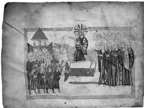
11. Миниатюра Вход в Иерусалим Евангелия Католикоса (вторая половина XI в.; Матенадаран, № 10780, X)