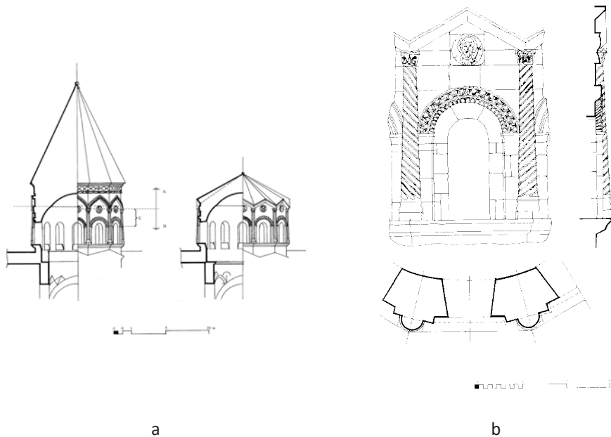
3. Собор Эчмиадзин: а – нынешний вид и реконструкция купольной главы VII в.; б – грань барабана VII в.