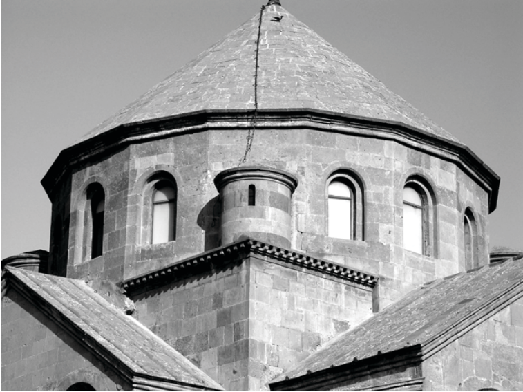
1. Храм Рипсима (618). Вид купольной главы с юго-запада