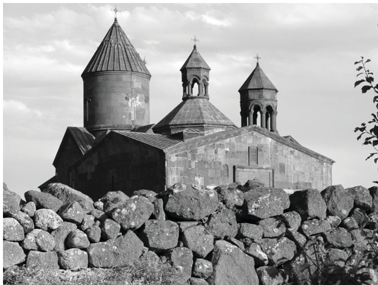
9. Монастырь Сагмосаванк (XIII в.), вид с северо-запада