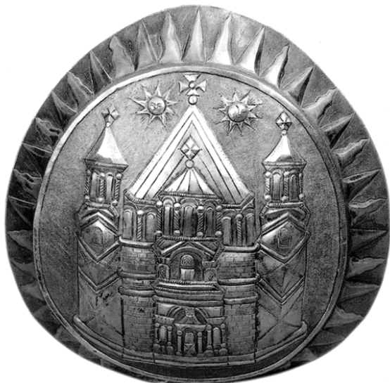
13. Серебряный сосуд для мира (Вавилон, 1815 г.; музей-сокровищница Эчмиадзина, металл № 311)