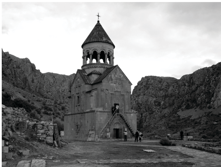
8. Церковь Аствацацин монастыря Норавапк (1339 г.), вид с северо-запада