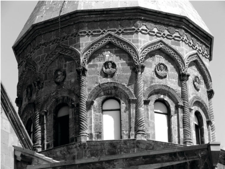
2. Собор Эчмиадзин. Барабан (около 620 г.; XVII в.)